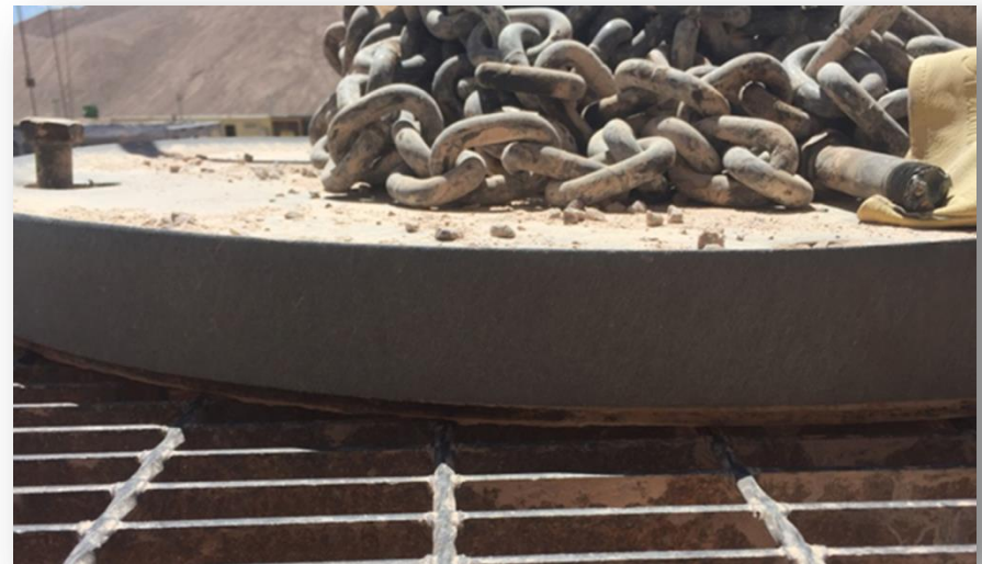
Sector del evento